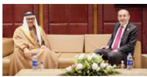
الاجتماع الدكتور عبداللطيف بن راشد الزياني وزير الخارجية، أمس، مع السيد أيمن الصفدي وزير الخارجية وشؤون المغتربين بالمملكة الأردنية الهاشمية، وذلك على هامش الاجتماع الاستثنائي لمجلس وزراء خارجية الدول الأعضاء في منظمة التعاون الإسلامي بشأن أفغانستان، المنعقد في مدينة إسلام آباد بجمهورية باكستان الإسلامية.

تم خلال الاجتماع بحث علاقات الأخوة الوطيدة بين البلدين وسبل تعزيز التعاون والتنسيق المشترك بما يخدم مصالح البلدين والشعبين