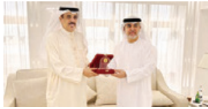
الاجتماع الدكتور ماجد بن علي التعييم وزير التربية والتعليم رئيس مجلس أمناء كلية عبدالله بن خالد للدراسات الإسلامية مع الدكتور حمدان المرزوقي رئيس مجلس أمناء جامعة محمد بن زايد للعلوم الإنسانية في دولة الإمارات العربية المتحدة. وذلك لبحث أوجه تطوير التعاون بين هاتين المؤسسات التعليمية، والذي يأتي في إطار العلاقات الوثيقة بين البلدين الشقيقين في جميع المجالات ومنها المجال التعليمي، حيث قدم الزائر شرحاً عن كلية عبدالله بن خالد للدراسات الإسلامية وأهدافها وبرامجها التطويرية وما تشمله من تخصصات، واستمع أيضاً إلى شرح عن البرامج الأكاديمية المتوفرة في شتى المجالات الإنسانية، متمنياً للتعاون بين البلدين ووزير التربية والتعليم يلتقي د. حمدان المرزوقي.

من تخصصات، واستمع أيضاً إلى شرح عن البرامج الأكاديمية المتوفرة في شتى المجالات الإنسانية، متمنياً للتعاون بين البلدين ووزير التربية والتعليم يلتقي د. حمدان المرزوقي.