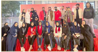
فريق المجلس الطلابي

متسنيي المملكة من عمداء الكليات وأساتذة وطلبة بهذا الاحتفال الكبير الذي يليق بجامعة المملكة الأردنية، وحرص أعضاء مجلس الطلبة على أن تصل الفرحة الوطنية للجميع من خلال برامج الحفل المتنوعة بداية من عروض "البوابة" التراثية وبين ظل الغرافي وأسعية شعرية وجهها الشعراء المبدعين الشاعر محمد الضحبي والشاعر عبدالله المري والشاعرة سبيكة الشحي منتقلين إلى أجمل الأنغام والأغنيات بصوت الفنان علي العوضي، وختاماً بالمسابقات والسحوبات على الجوائز القيمة، كما أتاح مجلس الطلبة لعربات الطعام والأسر المنتجة فرصة المشاركة بالفعايلة المميزة، وحرصاً على إسعاد الجميع كان هناك كرنفال ألعاب للأطفال والشباب.