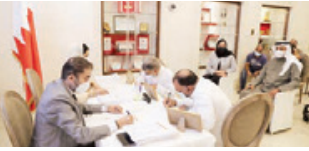
المواطنون يستكملون إجراءات تسليم الوحدات السكنية.